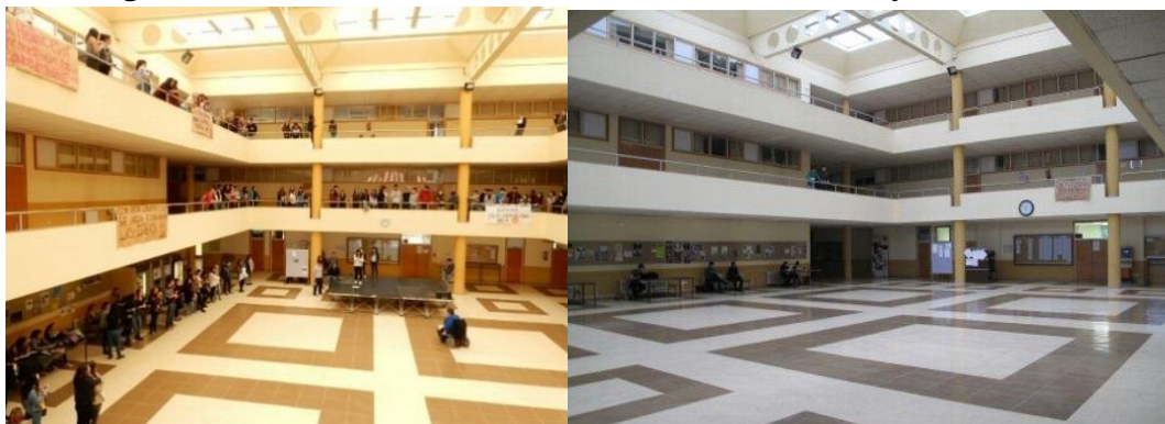
Figura 2. Universidad de León, Facultad de Filosofía y Letras, Hall