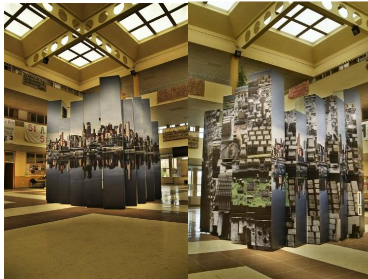
Figura 3. Universidad de León, Facultad de Filosofía y Letras, Instalación titulada Megapeligros. ©Sebastián Román

Las ideas fundamentales del proyecto artístico, el papel de los artistas y su selección, el proyecto que gestan, las categorías conceptuales y el arte público fueron las líneas trabajadas por los estudiantes (Castrillo, 2017). La colaboración de los alumnos en estas acciones, sin duda permitió acercar a los estudiantes al ámbito de la gestión cultural, conocer la génesis y desarrollo de un proyecto consolidado institucionalmente y que posee larga trayectoria y prestigio en el ámbito cultural de la provincia de León.